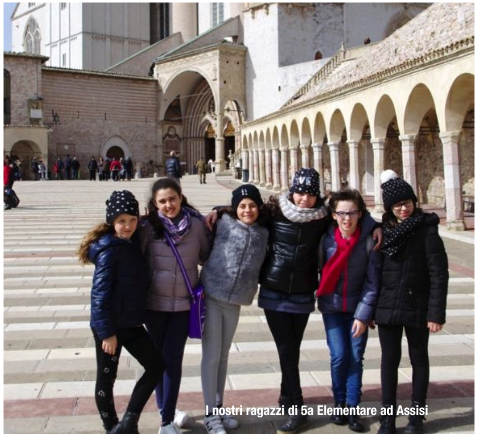
I nostri ragazzi di 5a Elementare ad Assisi